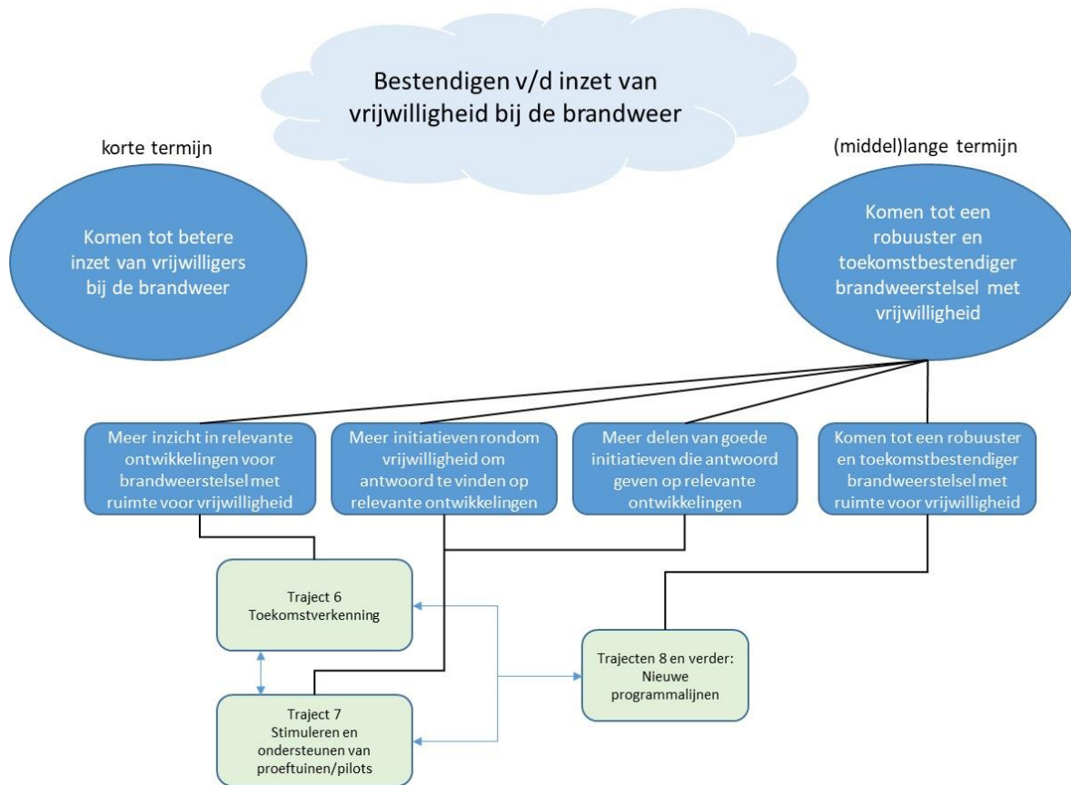
Figuur 3: Uitwerking specifieke doelen en trajecten voor (middel)lange termijn

Voor de (middel)lange termijn is de uitwerking naar specifieke doelstellingen en trajecten als volgt weer te geven: