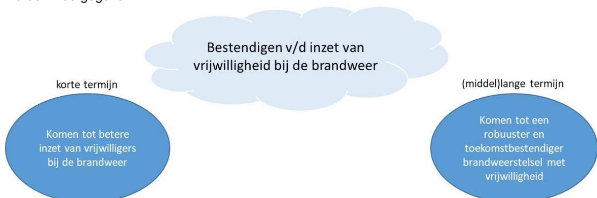
Figuur 1: Ambitie en doelen Programma Vrijwilligheid

Op basis van het voorgaande kan de ambitie van het programma vrijwilligheid schematisch als volgt worden weergegeven.