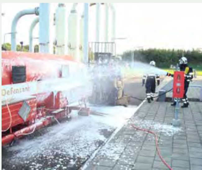
Gasunie: calamiteitenoefening Alphen aan den Rijn, 2009.