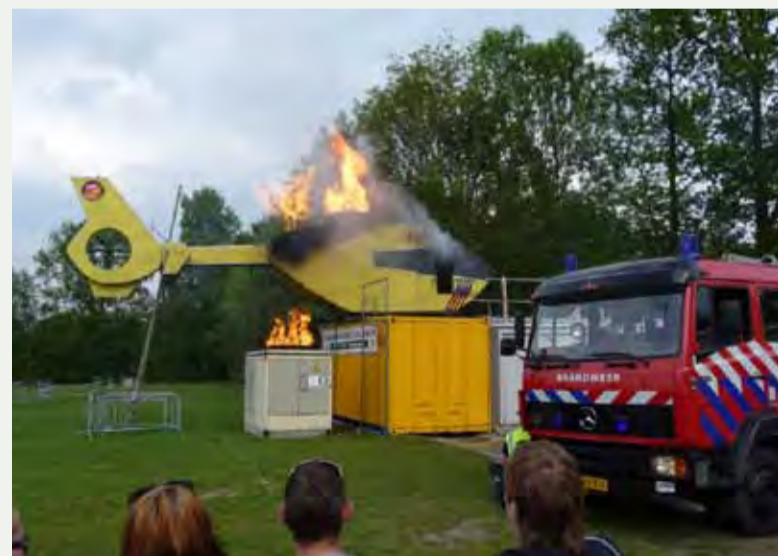
Liander: Naast bestuurlijke samenwerking wordt ook veel aandacht gegeven aan de operationele samenwerking. Tijdens de gezamenlijke oefening was er sprake van een helikopterbrand en een trafohuisje van Liander. De wederzijdse procedures werden bij de oefening getest.

De meerwaarde van een convenant ligt volgens hem in de eenduidigheid van de afspraken. Die gaan over oefeningen, opkomsttijden bij grote storingen, over verantwoordelijkheden en beschikbaarheid. Een groot deel draait volgens Nieuwland om het 'managen van verwachtingen', van besluitvorming en crisiscommunicatie tot en met de inzet van en het inzicht in noodvoorzieningen. Nieuwland: "Het is belangrijk dat je daar over en weer helder in bent. Dit voorkomt tijdens een echte crisis een hoop discussie."