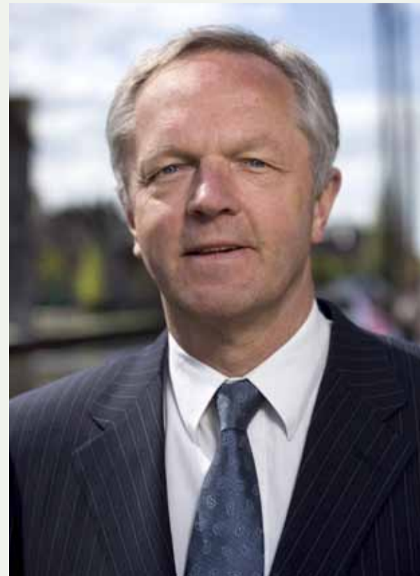
Meijer: "Zorg als burgemeester dat je je relatiernetwerk op orde hebt."

De veiligheidsregio ontwikkelt zich in de ogen van Meijer steeds meer tot 'regisseur van samenwerking'. Niet alleen voor de bekende vier kolommen, maar ook voor meer externe partners die een belangrijke rol vervullen bij de bescherming of waar nodig herstel van de vitale infrastructuur. Natuurlijk hebben de sectoren het liefst van doen met één veiligheidsregio die heel Nederland vertegenwoordigt, geeft Meijer zelf al aan. "Maar aan de andere kant gebeurt een incident of crisis wel op een locatie waar je te maken hebt met lokale mensen en bestuurders die de burgers vertegenwoordigen." Convenanten vormen naar zijn oordeel een uitstekend middel: "Het zijn richtinggevende afspraken waarbinnen ruimte is om regionaal aanvullende afspraken te maken, al naar gelang de cultuur of het risicoprofiel van de regio. Die ruimte moet er ook zijn, principieel en prak-