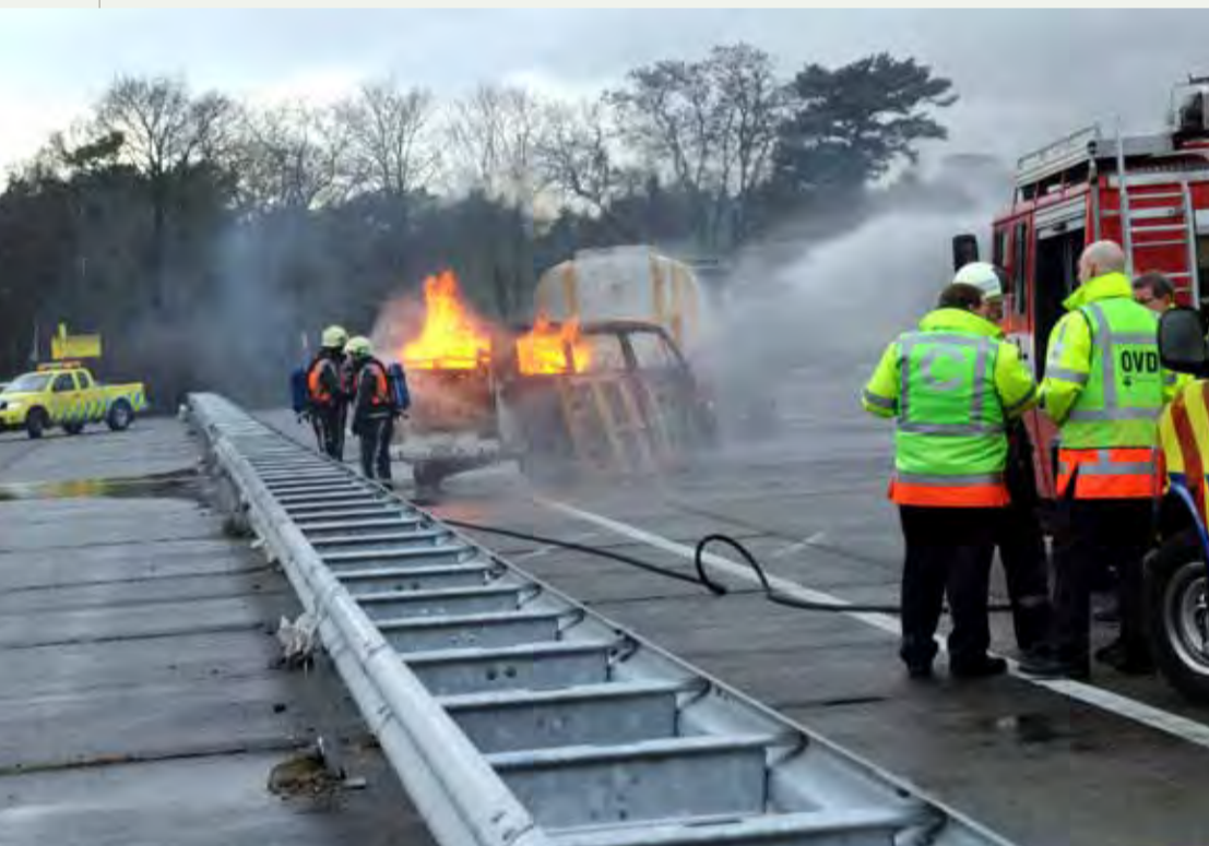
In het multidisciplinair oefencentrum in het Duitse Weeze worden officieren van dienst Rijkswaterstaat via realistische scenario's opgeleid en getraind.

der Hee vervolgt: "Voor een robuuste samenwerkingsrelatie is het noodzakelijk dat we zoveel mogelijk volgens uniforme afspraken werken. Dat schept voor alle partijen duidelijkheid en voorkomt onnodige vertraging en discussie in crisistijd."