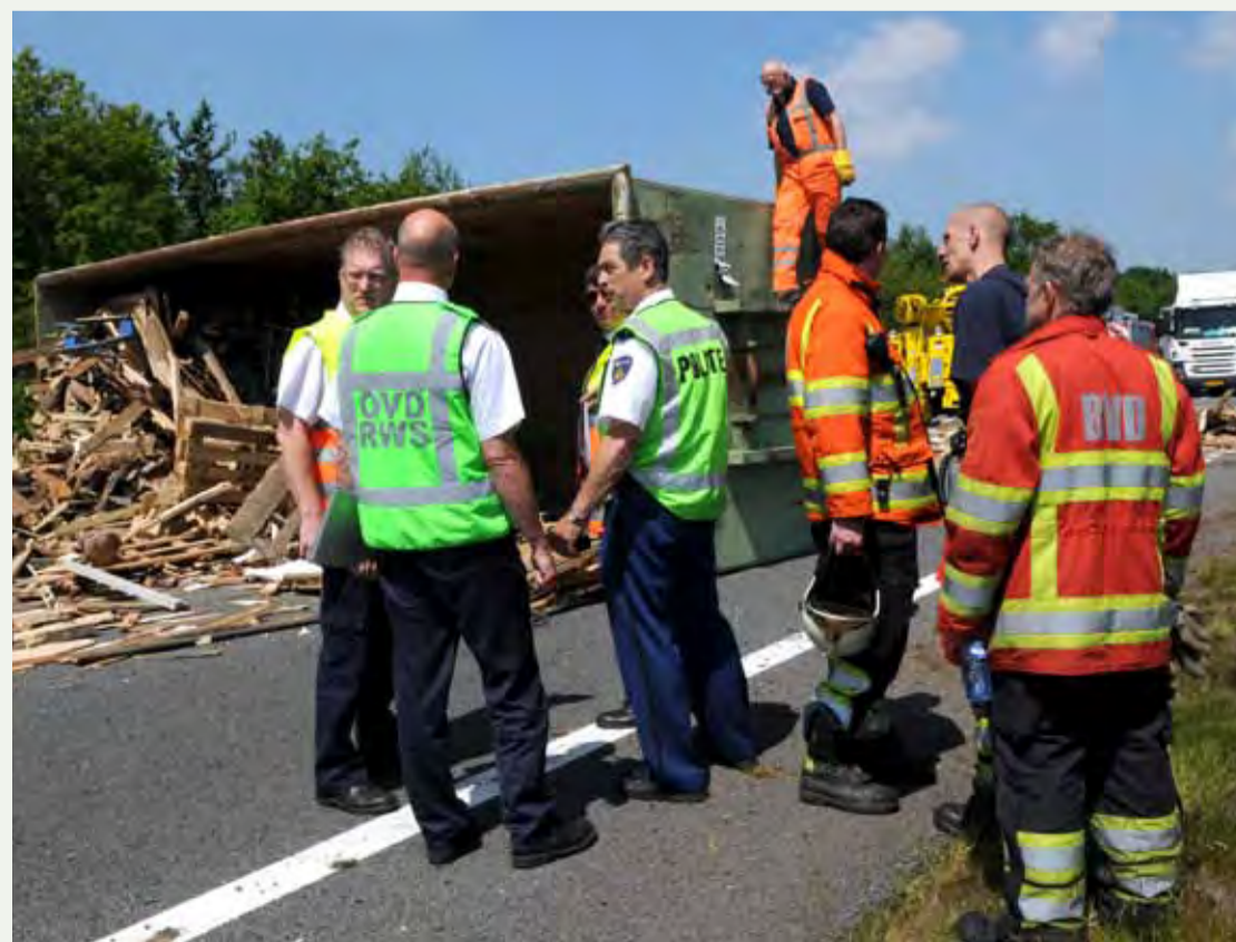
Officier van dienst Rijkswaterstaat in overleg met de hulpverleners.

Een volgende uitdaging is volgens Van der Hee het verder invullen van de rol van Rijkswaterstaat in de koude fase van de crisisbeheersing. Als grootste infrastructuurbeheerder kan Rijkswaterstaat immers ook bij risicobeheersingsvraagstukken een belangrijke inbreng leveren, met specifieke kennis en deskundigheid op het gebied van verkeer, vervoer en infrastructuur. "Effectieve samenwerking in alle schakels van de veiligheidsketen vraagt van de netwerkpartners dat zij over de grenzen van hun eigen organisatie of beleidsterrein willen kijken. In de af te sluiten samenwerkingsconvenanten met de veiligheidsregio's willen we dat voornemen bestendigen." //